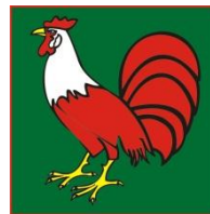
Movimiento Independiente Fuerza Regional

11. Por lo señalado, esta Dirección considera que la denominación adoptada por el movimiento regional “Innovación y Desarrollo Regional”, no incumple las disposiciones contenidas en el numeral 1) literal c) del artículo 6° de la LPP; ya que al no existir ninguna organización política registrada con una denominación igual o semejante en la región Piura, tampoco existe riesgo de confusión en el electorado, ni los supuestos invocados en el caso correspondiente al movimiento regional “Seguridad y Prosperidad” son aplicables pues se trata de casos distintos, dado que en este último caso, la similitud existente entre la denominación empleada por dicha organización política al presentar su solicitud de inscripción “ Seguridad y Desarrollo ” y las denominaciones empleadas por las organizaciones políticas “Alternativa de Paz y Desarrollo”, “Poder y Desarrollo”, era clara, debido a que dichas denominaciones fueron construidas de manera similar, y fonéticamente también lo son, conforme se puede apreciar. Por los motivos antes expuestos correspondería declarar infundada la tacha formulada por el recurrente al carecer de sustento alguno